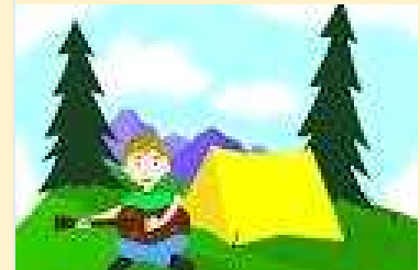
Γεωργία Δ. Πηνελόπη Λ.

Αμέσως μετά ακλουθεί το πρωινό γεύμα που συνήθως είναι γάλα άμα θέλουν παίρνουν και τσάι. Μετά από αυτό πηγαίνουν όλοι στα σπιτάκια τους για τον αγώνα γενικής καθαριότητας! Σε αυτόν τον αγώνα όλα τα σπιτάκια διαγωνίζονται για το πιο έχει καθαρίζει καλύτερα. Μετά όλοι περιμένουν μέχρι να αποφασιστεί το ημερήσιο πρόγραμμα. Όταν αποφασιστεί όλοι το ακολουθούν που συνήθως το πρώτο πράγμα είναι το μπάνιο στην θάλασσα. Η κατασκονίσει είναι μια υπέροχη απασχόληση!